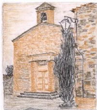
Le temple de Mus (R. Zehnder)